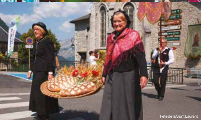
Fête de la Saint Laurent