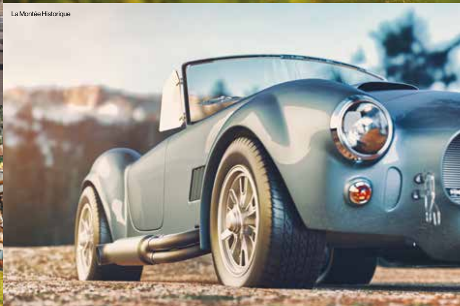
La Montée Historique