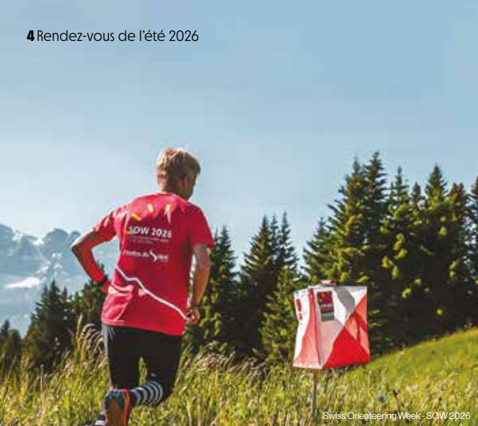
Swiss Orienteering Week - SOW 2026