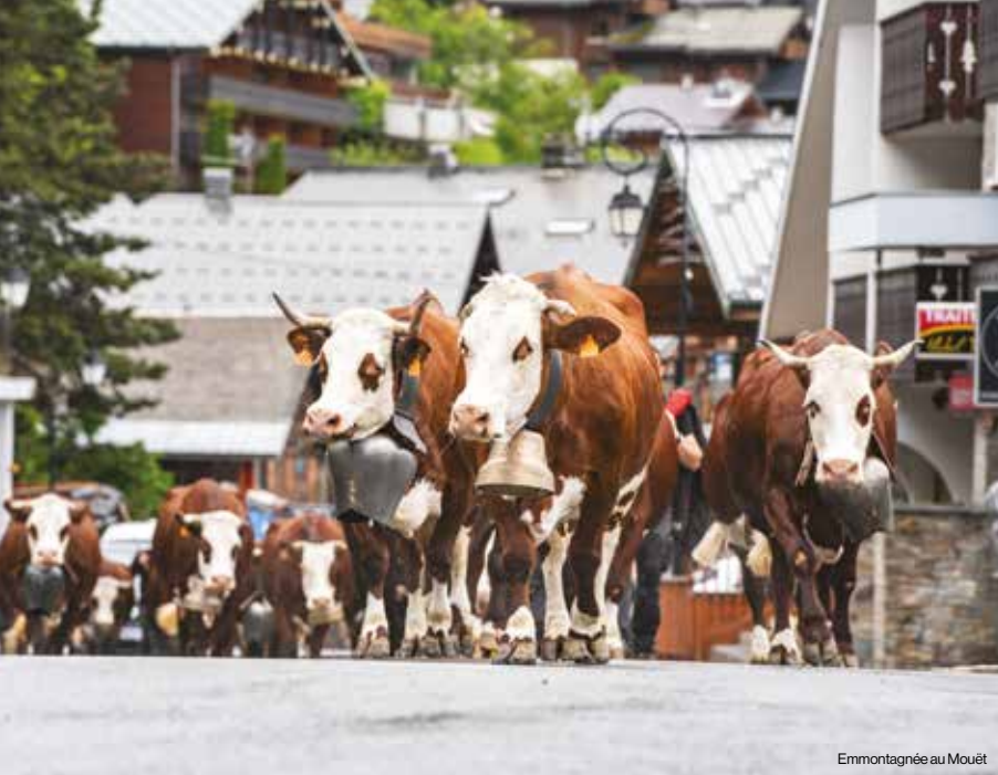
Emmottagnée au Mouët