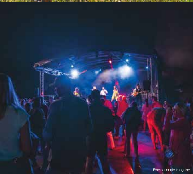
Fête nationale française