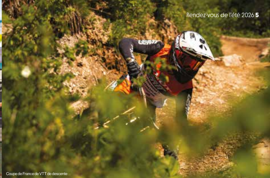
Coupe de France de VTT de descente