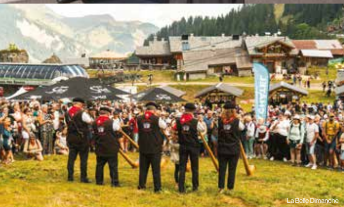
La Belle Dimanche