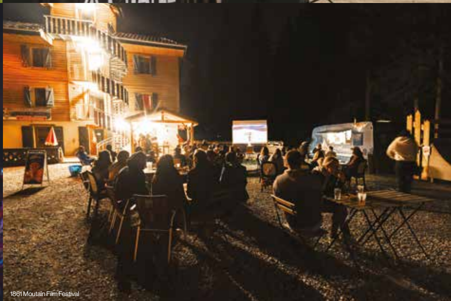
1861 Mountain Film Festival