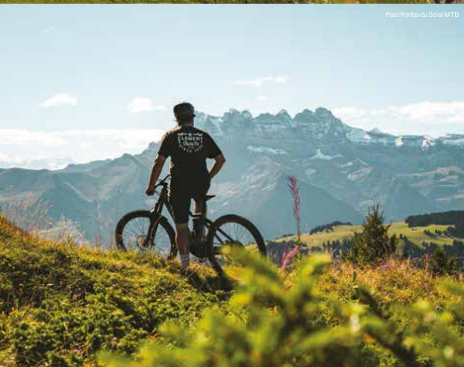
Pass'Portes du Soleil MTB