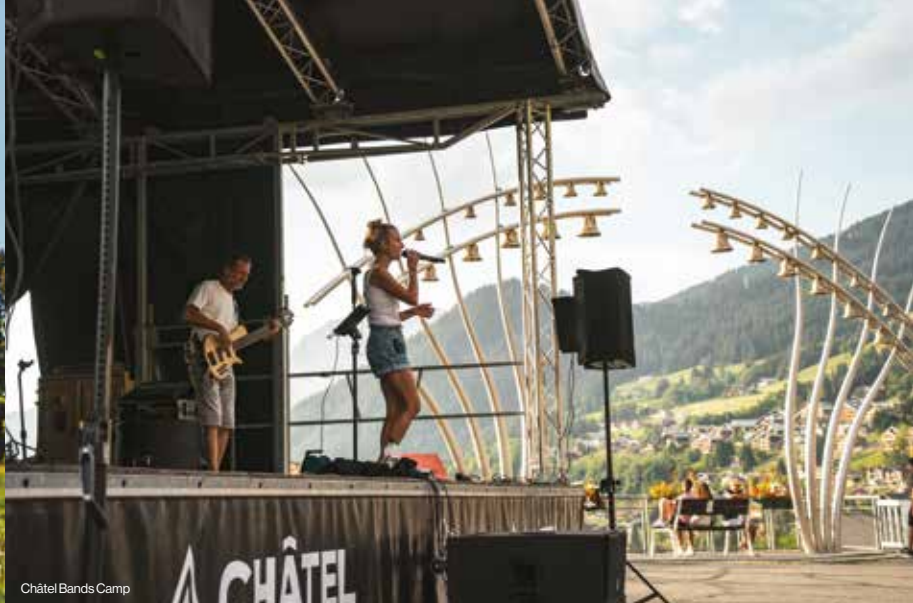
Châtel Bands Camp