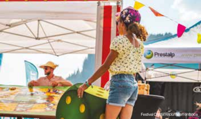
Festival Châtel retourne en enfance